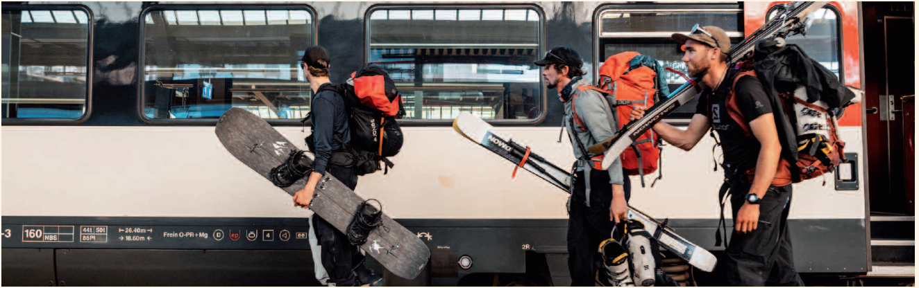
ITINERAIRE BIS

Nous nous regroupons pour parler d'une voix plus forte à nos homologues journalistes, créateurs de contenus, youtubeurs ou influenceurs, prescripteurs s'adressant à une audience plus massive que les nôtres, touchant des publics peu sensibilisés aux enjeux du tourisme. Après des années à travailler auprès de nos « communautés » respectives, une nouvelle étape, collective cette fois-ci, s'engage pour sortir de nos bulles « écolo » et faire rayonner ce en quoi nous croyons. Le collectif propose des ressources en ligne pour aider les prescripteurs à renouveler leurs lignes éditoriales et engage un travail de fond de plaidoyer auprès des journalistes des grandes rédactions presse et TV pour porter de nouveaux sujets ; angles ; territoires ; modes de déplacement et iconographies aux yeux et au cœur du plus grand nombre.