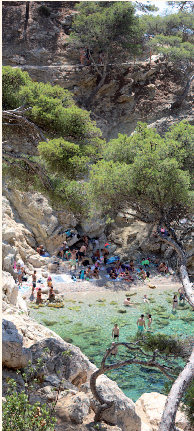
CALANQUE SUGITON - MARSEILLE