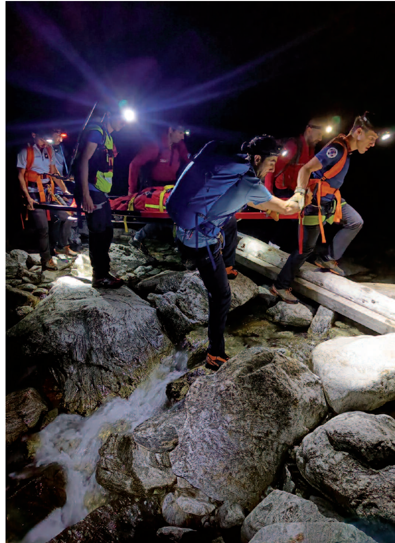
VALLÉE DE LA TINÉE - MASSIF DU MERCANTOUR

Si l'accident est tabou, la mort l'est encore plus. Quels traumatismes portent les proches des alpinistes décédés ? Ce n'est pas questionné