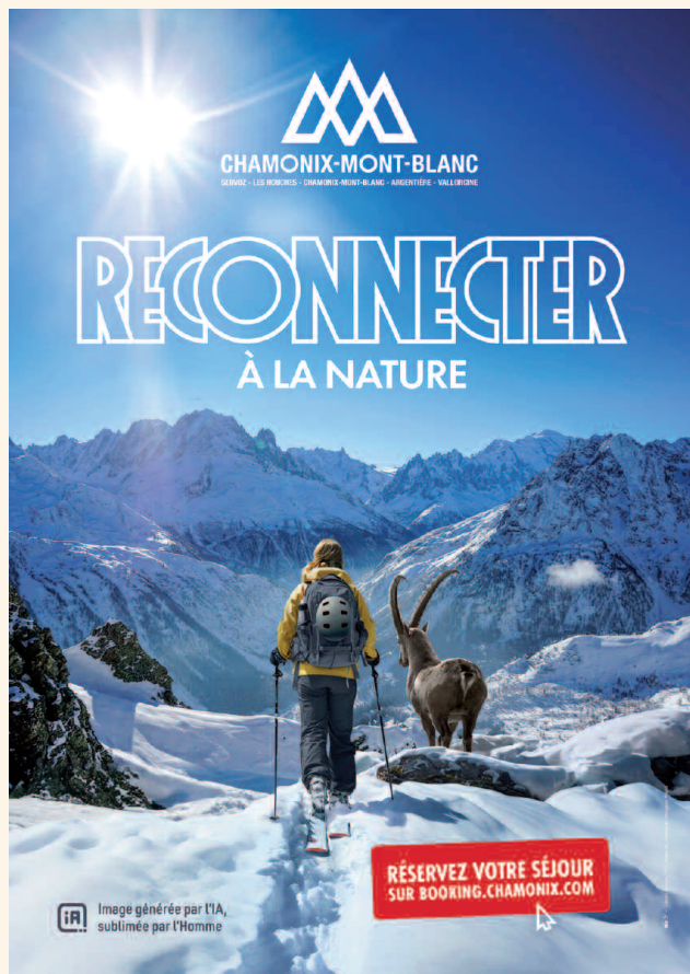
CAMPAGNE PUBLICITAIRE 2023 DE CHAMONIX-MONT-BLANC

Ainsi, les brochures des stations comportent un inventaire quantitatif des équipements : kilomètres et nombre de pistes, d'enneigeurs, de remontées mécaniques. Le logement trouve une place centrale dans l'offre, les stations y soulignent leurs efforts de « montée en gamme », avec de fréquentes « nouveautés » : hôtels et résidences de tourisme 4 ou 5 étoiles. Les offres d'activités sont pléthoriques pour la saison d'hiver, de plus en plus pour l'été et, c'est nouveau, pour l'automne. Le discours intègre les aspirations montantes pour le slow tourism, la préoccupation environnementale, la recherche d'authenticité avec des expériences immersives et sensorielles comme par exemple des visites et goûters à la ferme.