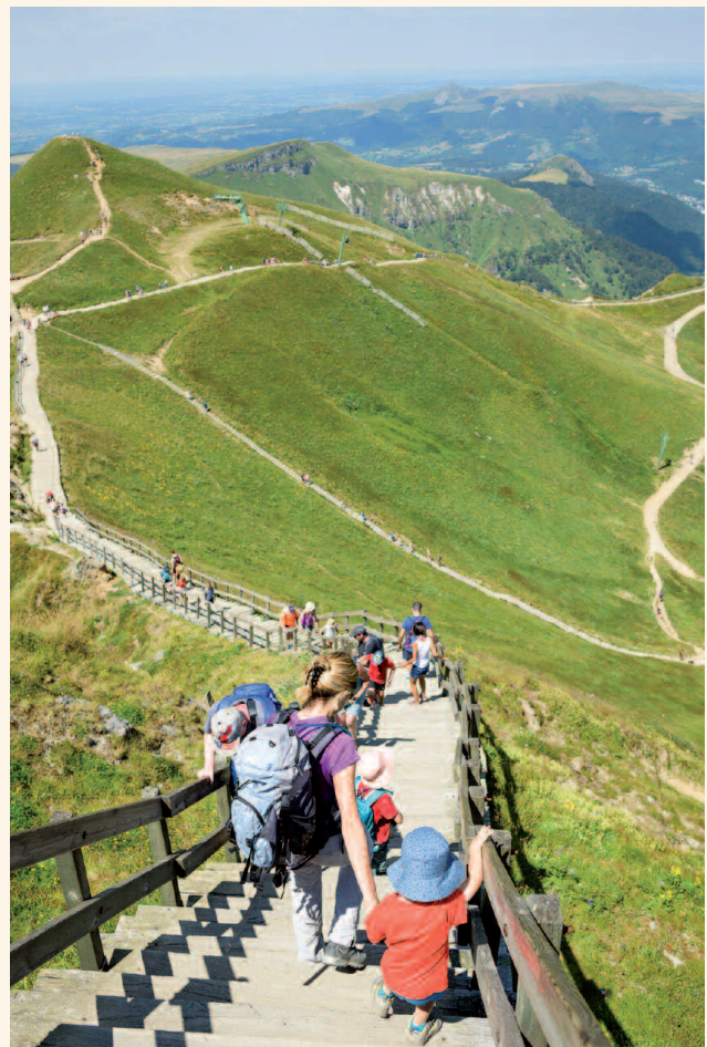
PLUY DE SANCY - MASSIF CENTRAL

Considérer ces questions demande de réfléchir à la place de l'humain dans les environnements de montagne. L'anthropologie a montré comment « la nature » est une conception culturelle qui n'a pas de