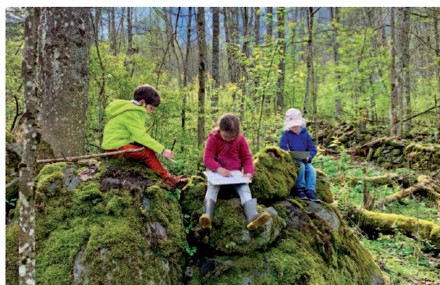
© IDE-Ô - LE LIEN NATUREL

Pourquoi « dans » la nature ? Parce que le contact direct avec elle permet de développer des valeurs de coopération, d'entraide et de solidarité tout en prenant en compte la santé et le bien-être des enfants. Ces valeurs sont essentielles, et particulièrement importantes dans les périodes que nous traversons actuellement.