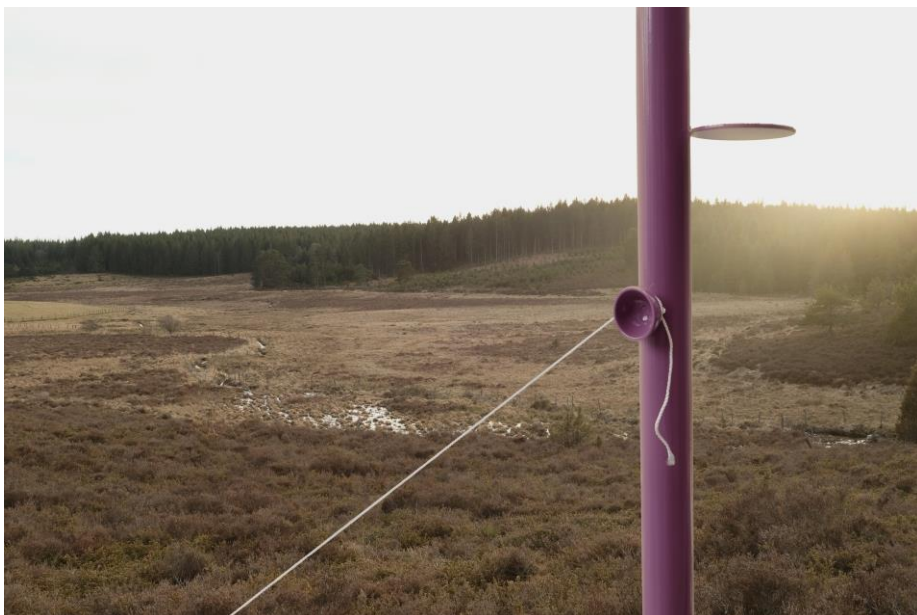
© PEAKS + Simon BOUDVIN, 2018