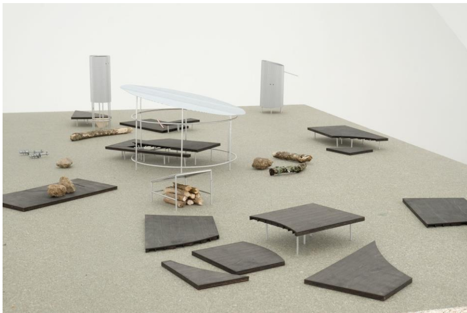
© PEAKS + Simon BOUDVIN, 2018

La proposition de PEAKS + Simon BOUDVIN s'appuie sur un système d'objets minimalistes pouvant être dispersés selon les situations. Ces objets font signe, ils répondent à leur fonction et jouent avec l'intelligence du randonneur pour s'ouvrir à d'autres usages (support d'un toit, porte-manteau, etc.). Le modèle proposé s'intègre parfaitement dans le paysage.