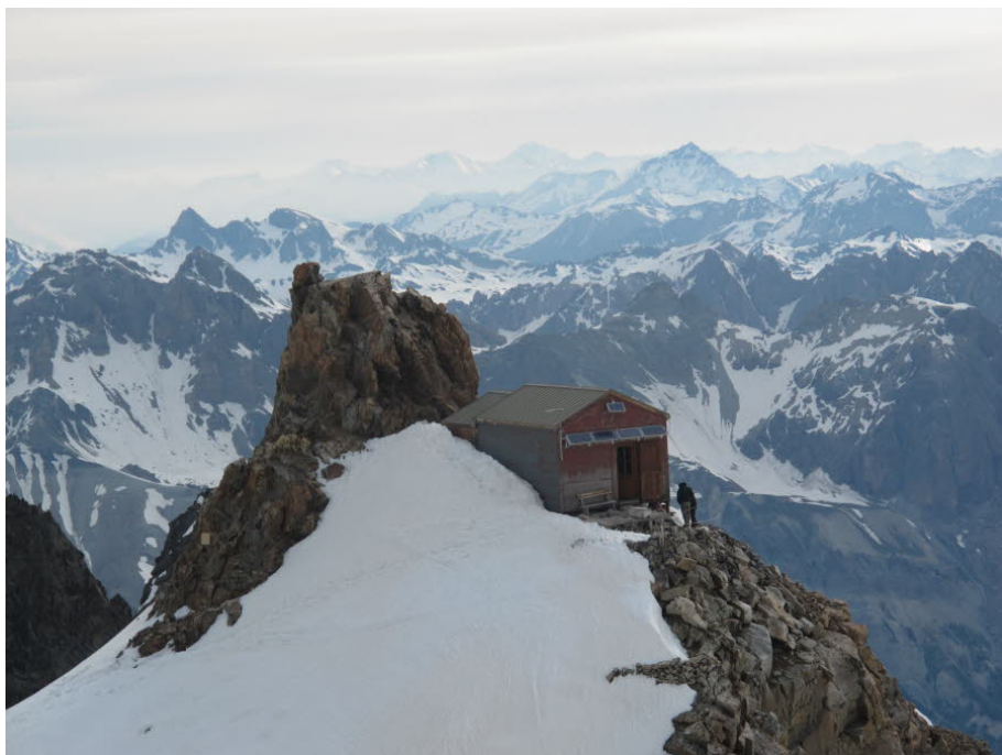
Visite de la cabane pittoresque à 3440m qui doit être démontée pour une reconstruction à l'été 2014, sauf rebond judiciaire. L'architecte retire le bardage et évalue l'état de l'ossature d'origine conservée dans le futur bâtiment.